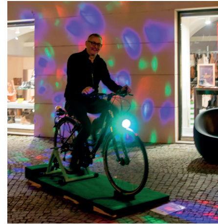
FAHRRAD+ Oben: Standort Täglicher Markt, unten und rechts: Neutaugasse